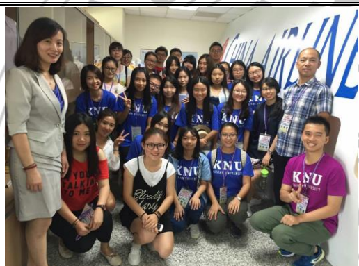
在机舱教室进行讲座课程实作