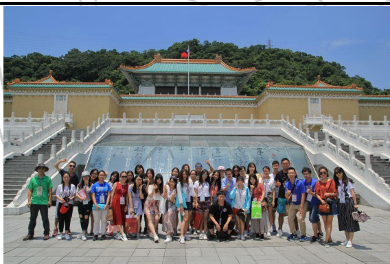
历史文化体验课程