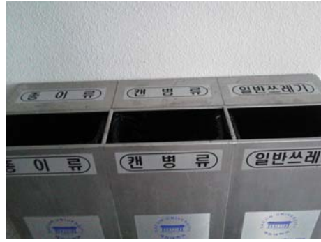
大真大学很注重环保 垃圾分类