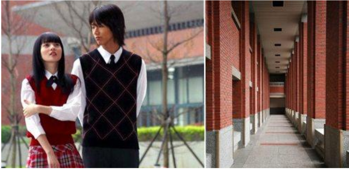
《流星花園》 1 、《愛殺17》 2 、等偶像劇到此拍攝