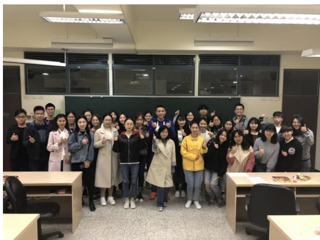
大陸交換生歡迎會